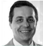
Dr. med. Ignazio Cassis

Vizepräsident FMH; Facharzt für Innere Medizin FMH sowie für Prävention und Gesundheitswesen FMH; Nationalrat